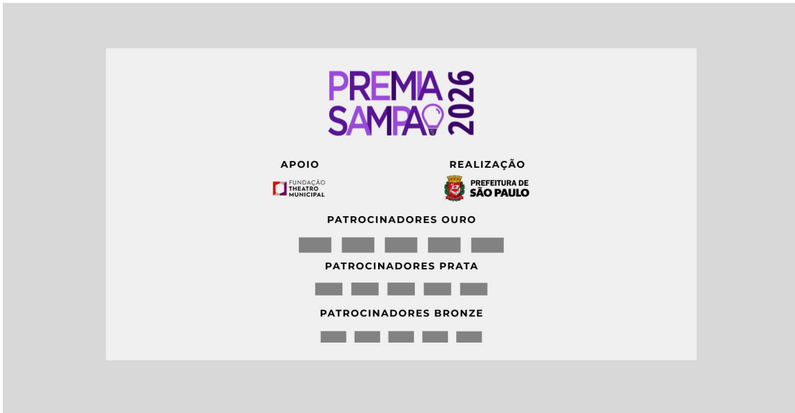
MODELO B – BACKDROP (5mx2m)